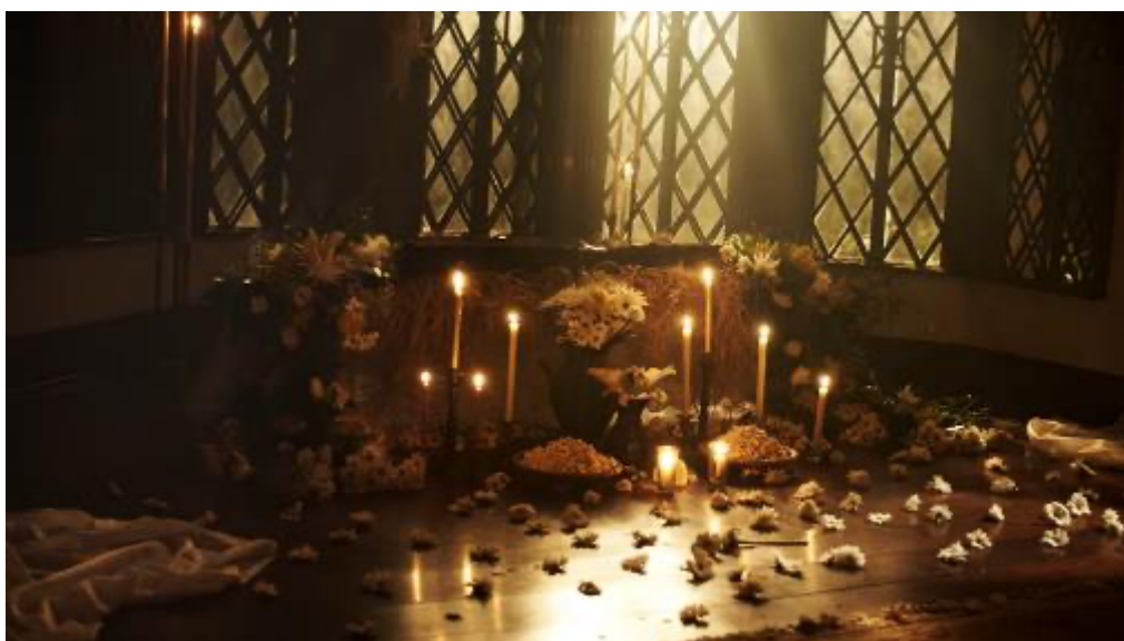
Imagem 1: O ebó para Obaluaê.

Ligado às performances que convocam o emocional dos corpos – apesar de ser gravado, decupado, dublado – mantém a força da forma , mesmo dentro da ritualidade do padrão narrativo do videoclipe. A face oculta de Obaluaê parece ser convocada por meio do buquê da flor de milho para a cura de uma chaga – familiar e coletiva –, além do artístico. 14