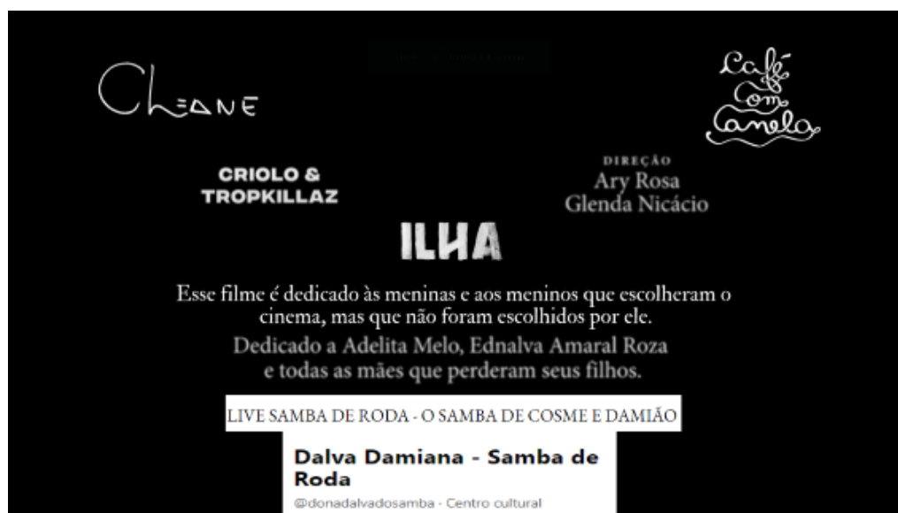
Imagem 2: Circulação do axé no abraço possível.

O signo do abraço não vem à toa, ele é de grande importância para a expressão dos afetos, do amor, da ética amorosa (hooks 2021), e, ao mesmo tempo, é uma das interdições/possibilidades, devido às medidas sanitárias de controle do contágio da pandemia de COVID-19, que tornaram inviável, no luto ou no aniversário, duas situações aqui trazidas pelos corpos em cena ( performance ) e da cena (perspectivas estéticas de encenação). Nem o abraço que deseja mais vida ou sequer um último abraço: neste momento, estes são gestos interditos na vida ordinária. Contemplamos o diálogo entre obras e convidamos o nosso leitor que se aproxime, neste abraço coletivo, na busca por transcender a voz interior e, caso queira, ler em voz alta e na direção que desejar os elementos que compõem o diagrama abaixo, montagem umbigada a partir dos títulos e dedicatórias dos audiovisuais trazidos para esta abordagem, ou seja, do legível que os habita e que por meio deles circula.