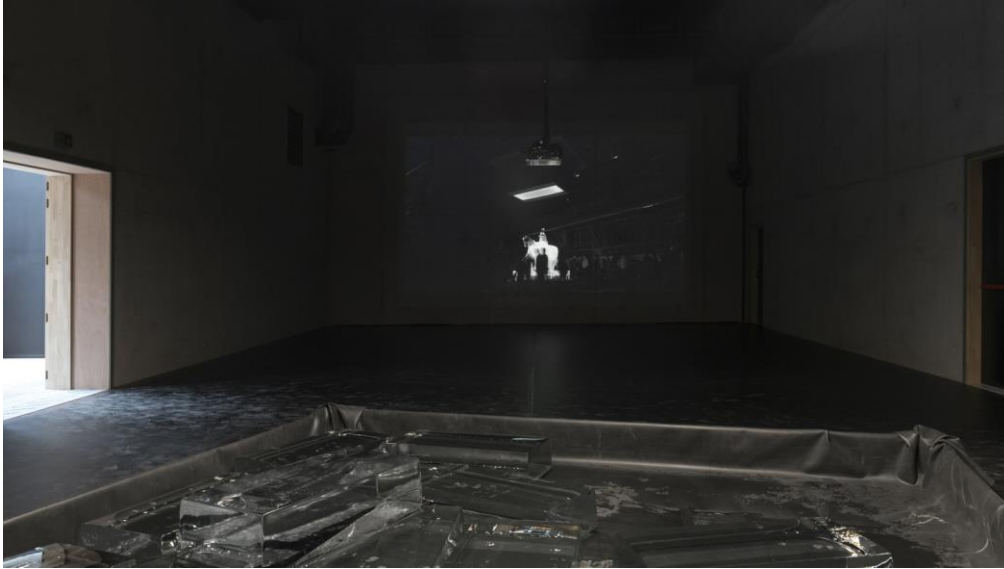
Imagem 2: PeoPL (2018), de Laura Nsengiyumva, instalação apresentada na Contour Biennale.

A maior parte desses documentos fala de homens brancos; há muito poucas mulheres. Todos esses homens brancos estão ligados ao enriquecimento dos países através da colonização, tal como em França, em Portugal, na Bélgica, em Espanha, em Inglaterra, na Escócia e, um pouco menos, na Alemanha. Quanto mais avançamos para Leste, mais as estátuas são ideológicas. Na Eslovénia, por exemplo, aquando da mudança de regime, algumas estátuas, como as de Tito, foram atacadas, recontextualizadas e deslocadas, colocadas em museus. Li algures que as estátuas devem ser vistas como “dejetos nucleares”, ideia que me pareceu muito pertinente. São dejetos tóxicos de um passado que importa evocar, mas não necessariamente mostrar no espaço público. Ou colocamos esse passado num envelope protetor, sabendo que continua lá, tal como acontece com os dejetos nucleares, ou, aspeto que se relaciona com a questão das instituições, levamos a cabo um trabalho reflexivo e crítico com respeito a esses monumentos. Nos museus de história contemporânea, encontramos esses monumentos, como acontece no meu país, à vista, mas narrados de outra maneira.