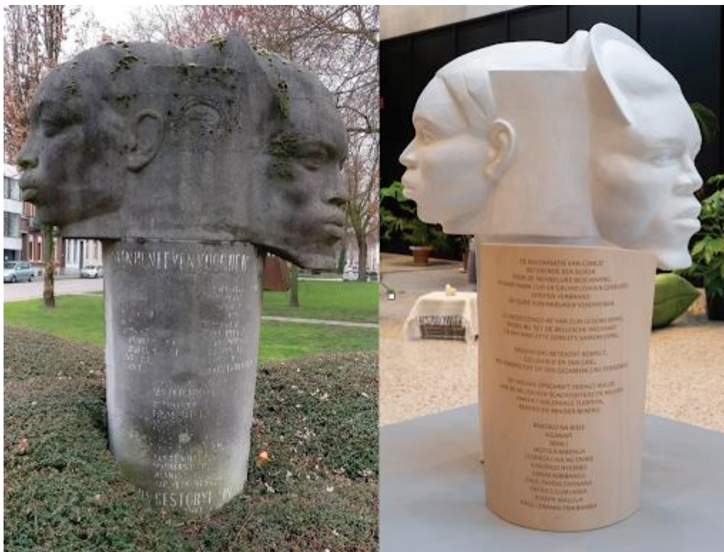
Imagem 1: Composição com a escultura original de Lode Eyckermans, em Mechelen, 1953 (à esquerda) e “The Copy”, de Bie Michels, 2019, com a nova inscrição (à direita).

Catarina Boieiro e Raquel Schefer – Talvez possamos começar pela curadoria da Contour Biennale, um dos projetos mais importantes que fizeste recentemente. A tua proposta para a 9ª edição da bienal, sob o título “Coltan as Cotton” em Mechelen (Malinas), 3 marcou uma mudança radical do formato habitual desta bienal, assim como da maioria das bienais de arte. Podes falar-nos das especificidades desta tua proposta curatorial, para uma bienal que seja organizada de forma sustentável (por oposição ao capitalismo cultural, ou seja, oposição à lógica de crescimento permanente do sistema capitalista e à mercantilização global do campo artístico)?