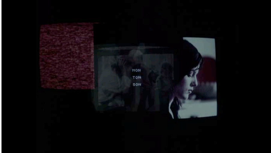
Imagen 3 : Animar al espectador a escuchar el sonido, in 4.56.20 (João Tabarra, 2016) © João Tabarra

La frase “Entonces ponemos música” que pronuncia Sandrine en Animar al espectador a escuchar el sonido es el único sonido presente en la siguiente proyección. La música se representa de manera metonímica a través del baile de Sandrine, desnuda bajo su albornoz y danzando delante de su hijo, o de los auriculares que ella misma lleva en otro momento del film. Repeticiones, superposiciones de imágenes, entre ellas un detalle de una relación sexual entre la pareja, parecen alentar al espectador a escuchar las emociones fijadas en los fotogramas. En los últimos segundos, la proyección se transforma en tres pantallas de televisión donde aparecen las palabras MON TON SON IMAGE ET SON (MI, TU, SU, IMAGEN Y SONIDO) jugando con el nombre del productor del film y la polisemia de los determinantes posesivos en francés.