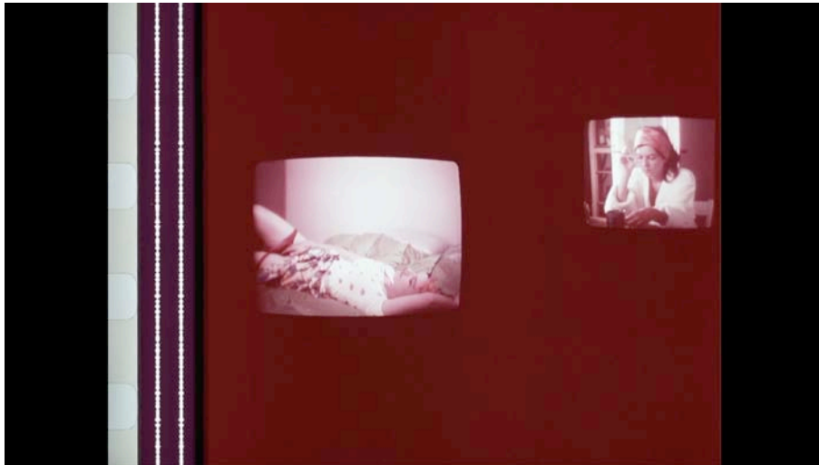
Imagen 2 : Simbolizar la manera en que la ideología oscurece al mundo, in 4.56.20 (João Tabarra, 2016) | © João Tabarra

El silbido de los pájaros y los gritos infantiles nos conducen a la siguiente sala en la que encontramos Simbolizar la manera en que la ideología oscurece al mundo . Esta pantalla se compone de dos imágenes de video sobre fondo rojo que muestran a Sandrine masturbándose. La diferencia entre las dos es que una pertenece a la versión original y la otra a la versión restaurada por Tabarra. Estas imágenes nos interpelan y parecen preguntarnos: qué oscurece al mundo? Nuestros prejuicios sexuales? La invisibilidad social de estos momentos de placer íntimo? Quizá este fragmento evoque una cierta moralidad que impone pudor y secretismo a un acto natural.