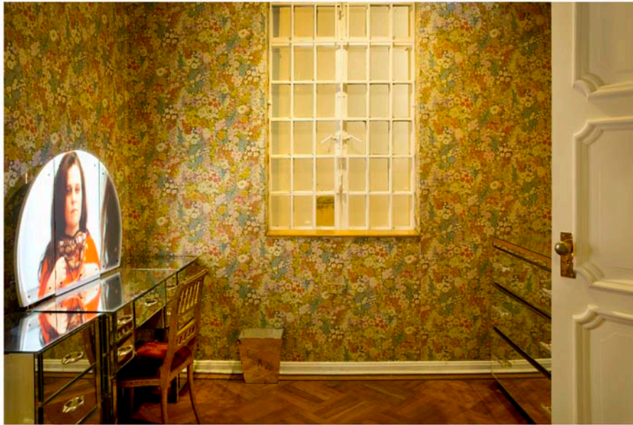
Figura 3: Noche es día - Vista de la exposición (Katia Maciel, Collar , 2009) © Katia Maciel y Museo La Tertulia

Lo que vendría ahora sería el proceso de escoger las obras, y los lugares de la casa dónde se instalarían. La idea era usar la mayor parte de espacios: el hall, la cocina, el comedor, la sala, los cuartos, los vestiers, los baños. El éxito consistiría en escoger el mejor trabajo para cada espacio, haciendo una labor de ida y vuelta, que implicaba revisar con cuidado la obra completa de los dos artistas, buscando cuáles trabajos deberían ser incluidos y dónde.